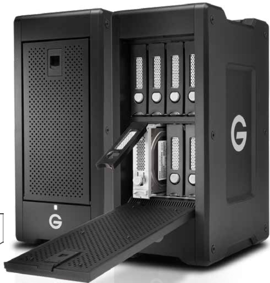
Solution de stockage Thunderbolt 8 baies RAID matériel, transportable