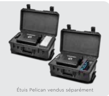
Étuis Pelican vendus séparément