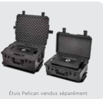
Étuis Pelican vendus séparément