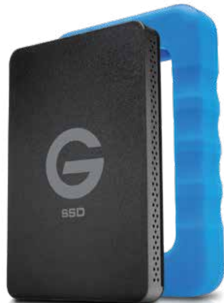
Disque SSD USB 3.0 robuste et léger