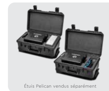
Étuis Pelican vendus séparément

Une rapidité et des performances RAID incroyables Solution de stockage RAID à 8 baies transportable et dotée de Thunderbolt 3