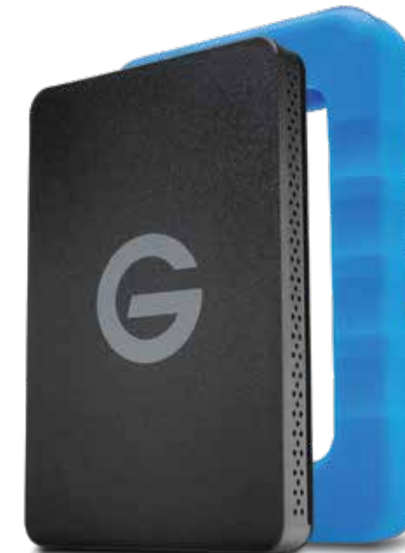
Disque dur USB 3.0 robuste et léger avec renfort de protection